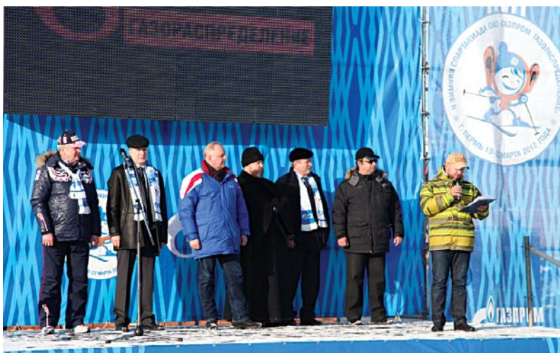
Почетные гости. Открытие Спартакиады