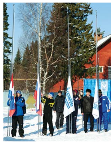
Торжественный момент поднятия флагов Российской Федерации, Пермского края, ОАО «Газпром газораспределение» и ЗАО «Газпром газораспределение Пермь»

С 19 по 21 марта в г. Перми на базе ЗАО «Газпром газораспределение Пермь» проходила II зимняя Спартакиада ОАО «Газпром газораспределение» среди работников газораспределительных организаций. В Спартакиаде приняли участие команды 27 газораспределительных организаций России, более 160 человек, в том числе команда ОАО «Тамбовоблгаз».