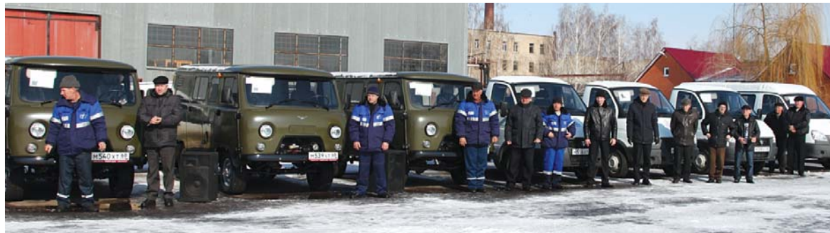
Колонна новых автомашин