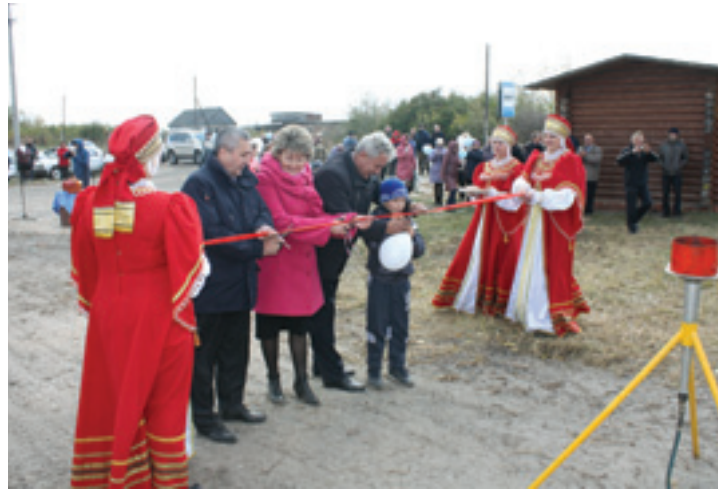
Торжественный пуск газа в селе Ранино

Благодаря конструктивному взаимодействию руководства Тамбовской области, администрации Мичуринского района и ОАО «Газпром» состоялось значимое событие для жителей сел Александровка и Ранино – пуск газа.