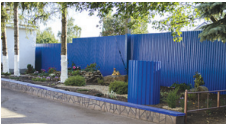
На всей территории филиала ОАО «Газпром газораспределение Тамбов» в посёлке Коммунар чистота и порядок

Конкурсное жюри оценивало работу по следующим критериям: санитарное состояние территории (наличие освещения, ограждения, дорожек, удобного подхода к зданию); организация и содержание садово-паркового комплекса (декоративно-цветочные насаждения, альпинарии, цветочные клумбы, водоёмы, вертикальное озеленение и др.). Учитывались целостность и благоустроенность подъездных путей к зданиям, наличие стоянки для личного и служебного транспорта, состояние производственных территорий, в частности – аварийно-диспетчерских служб, складских и гаражных помещений.