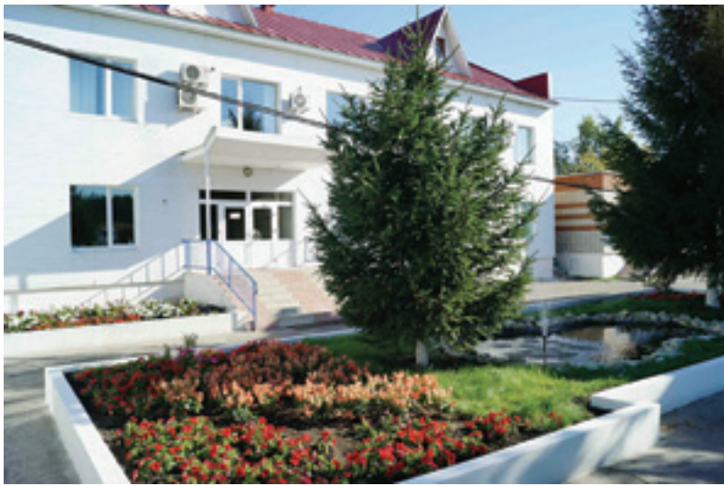
Отремонтированное здание офиса, яркий ковёр из цветов и зелёной травы, пушистые ёлки, фонтанчик – так выглядит территория филиала ОАО «Газпром газораспределение Тамбов» в городе Рассказово

Второй год подряд работники филиалов и центрального офиса ОАО «Газпром газораспределение Тамбов» активно занимаются благоустройством территорий около административных зданий. Благодаря проведению капитальных ремонтов, заметно изменились в лучшую сторону административные здания и кабинеты центрального офиса, филиалов и газовых участков.