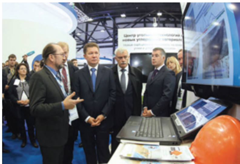
Председатель правления Алексей Миллер (в центре) в выставочном зале

Открыл форум Председатель Правления ОАО «Газпром» Алексей Миллер, дав старт международному пробегу заводских автомобилей на природном газе «Голубой коридор – 2014», который пройдет через 14 стран с целью популяризации применения природного газа в качестве моторного топлива. По его словам, газомоторное топливо является одним из приоритетных направлений газовой промышленности как в России, так и в Европе, и его использование позволит сократить транспортные расходы и выбросы вредных веществ в окружающую среду.