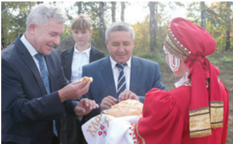
Хлеб-соль дорогим гостям

Кантеев, комплексная работа по газификации Тамбовщины будет продолжена. В текущем году будет газифицировано 30 объектов, в следующем – ещё сорок семь.