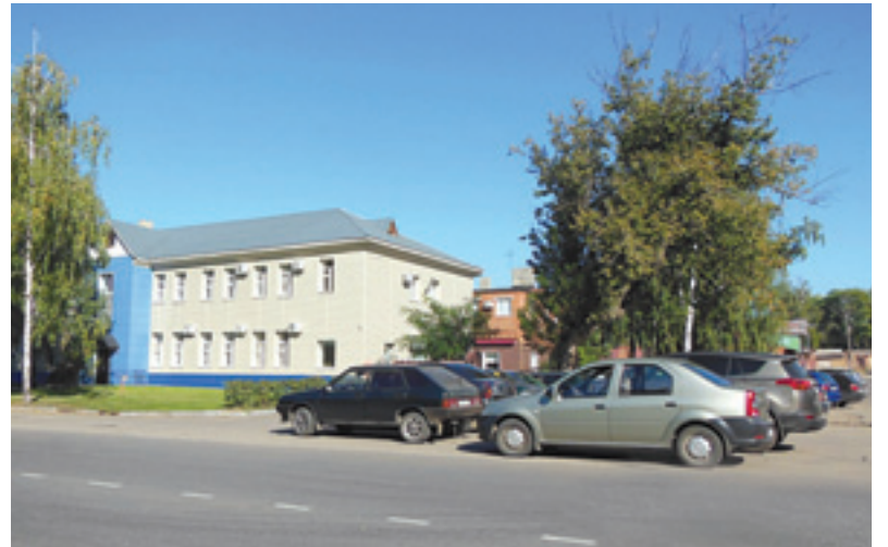
Стоянка для личного и служебного транспорта около офиса в филиале ОАО «Газпром газораспределение Тамбов» в городе Котовске

«Смотр-конкурс – это не только соревновательное мероприятие, но хорошая возможность перенять лучшее у своих коллег. Например, в прошлом году нам понравилось, как благоустроили свою территорию работники филиала ОАО «Газпром газораспределение Тамбов» в городе Котовске, сделав небольшой ручеек с альпийской горкой. Прекрасная зона отдыха. Это нас вдохновило, и мы сделали небольшой фонтанчик перед зданием