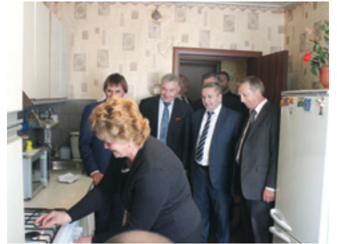
В гостях у жительницы села Александровка