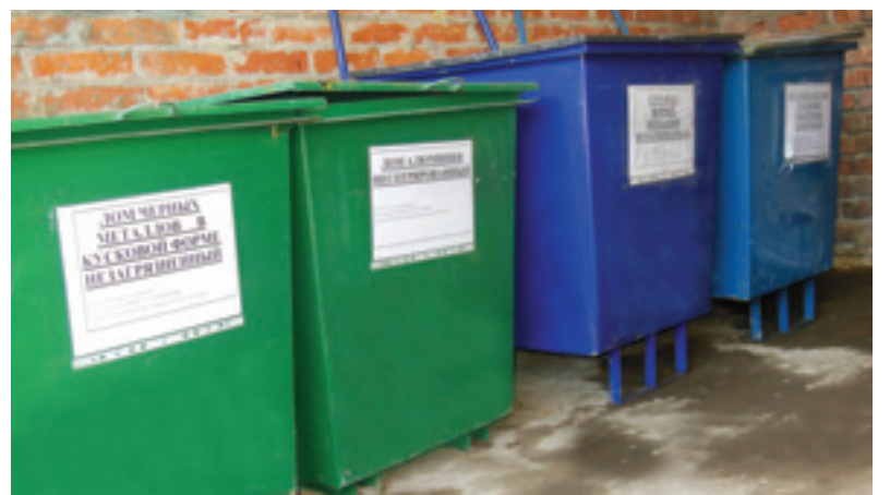
Отходы производства и потребления в филиале ОАО «Газпром газораспределение Тамбов» в городе Котовске хранятся в специальных контейнерах на промышленной площадке