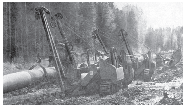
Укладка участка магистрального газопровода по территории Моршанского района от первого в России магистрального газопровода Саратов – Москва. 1958 г.

Технически грамотный и умелый руководитель был всегда требователен к себе и подчинённым. Много внимания уделял повышению технического образования работников газового хозяйства.