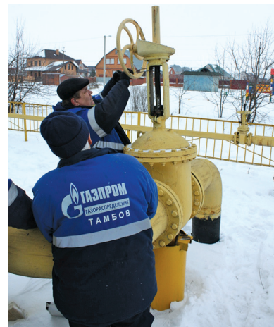
Аварийная бригада АДС ПТУ устраняет утечку газа во фланцевом соединении задвижки

Безусловно, такие тренировки будут продолжаться и в дальнейшем, потому что их проведение – это вклад в обеспечение безопасного газоснабжения. ■