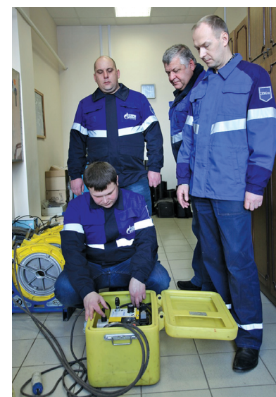
Практическое занятие на сварочном аппарате-полуавтомате для сварки полиэтиленовых труб встык «Протофьюз»

На 2015 год запланировано проведение 34 семинаров для специалистов и рабочих и семи смотров-конкурсов, обучить по рабочим специальностям 233 человека, а также строительство учебно-тренировочного полигона.