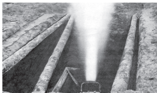
Продувка газопровода через патрубок «КИМС»