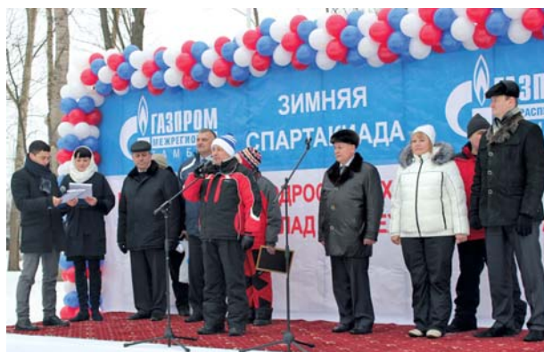
Торжественное открытие зимней спартакиады