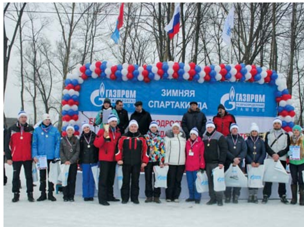
Призёры лыжной эстафеты

27 марта 2015 года на лыжном стадионе в парке Дружба в г. Тамбове газовики провели зимнюю спартакиаду среди работников ОАО «Газпром газораспределение Тамбов» и ООО «Газпром межрегионгаз Тамбов». Более пяти тысяч участников и болельщиков из всех районов области приняли участие в празднике спорта.