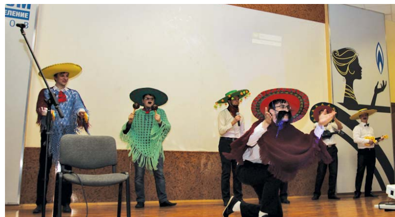
Поздравление от мужчин ОАО «Газпром газораспределение Тамбов»

6 марта в актовом зале центрального офиса ОАО «Газпром газораспределение Тамбов» состоялось торжественное мероприятие, посвященное Международному женскому дню 8 Марта.