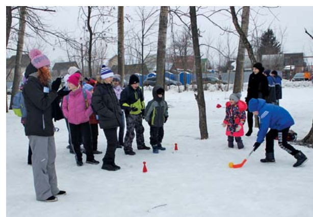
Весело на детской игровой площадке