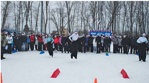
Участники соревнований по бегу в мешках упорно стремятся к победе