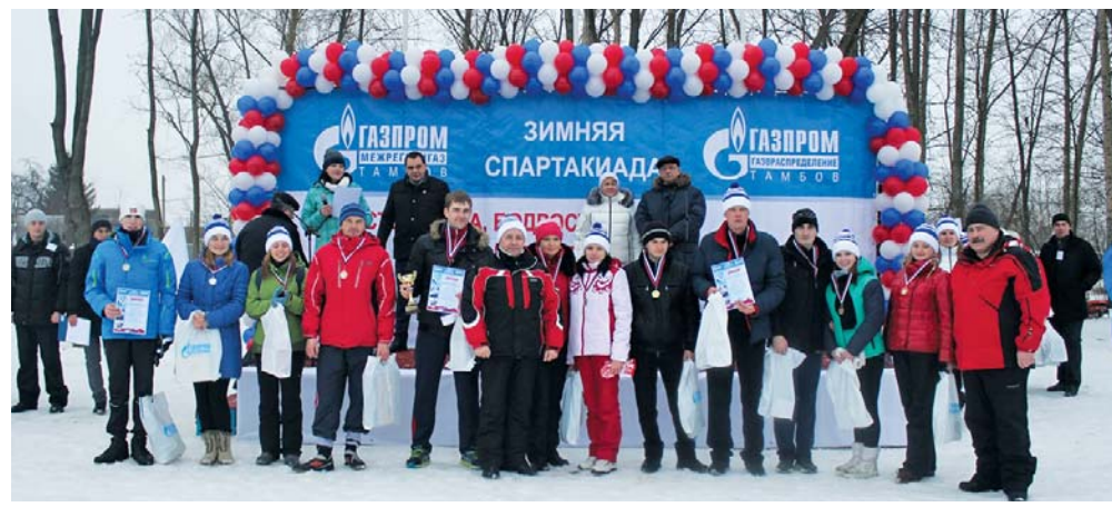
Призёры бега в мешках

Над материалами газеты работали Семён Шабанов, Надежда Раева