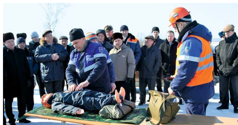
После отработки основных вводных учений на объекте газораспределения работниками аварийно-спасательного формирования ОАО «Газпром газораспределение Тамбов» были продемонстрированы навыки оказания первой медицинской помощи