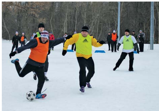
Футбольные баталии на снегу