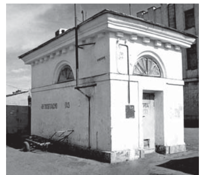
Первый газораспределительный пункт по улице Октябрьской в районе Центрального рынка