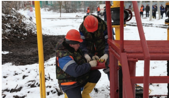
Аварийные службы филиала оперативно определили масштаб затопления, выявили степень опасности и приступили к ликвидации аварийной ситуации согласно плану учений