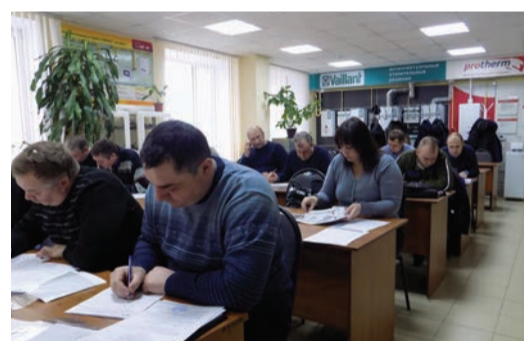
Подготовка к аттестации специалистов по визуальному и измерительному методу контроля