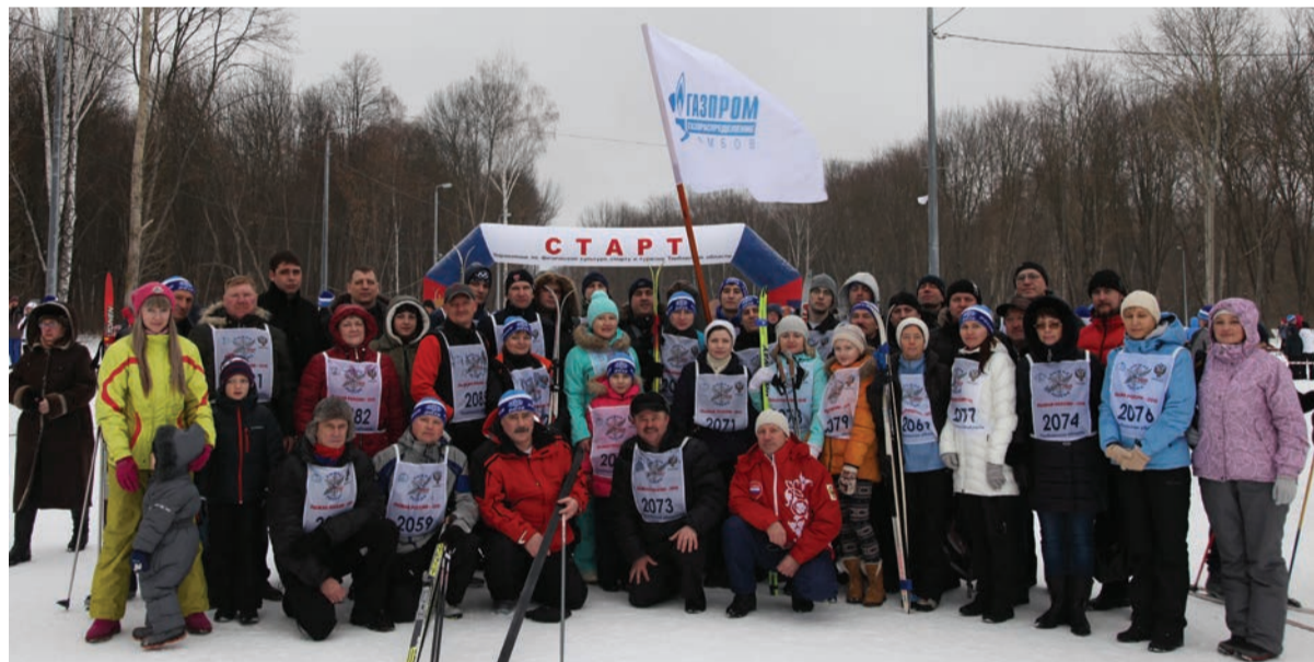
Сотрудники АО «Газпром газораспределение Тамбов» — участники и болельщики «Лыжни России — 2016»