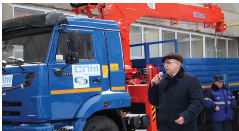
Открытие мероприятия по передаче новых автомобилей в филиалы компании

12 февраля на территории центрального офиса АО «Газпром газораспределение Тамбов» состоялась передача новых автомобилей в филиалы компании. 21 новый автомобиль пришел на смену машинам с большим пробегом и сроком эксплуатации.