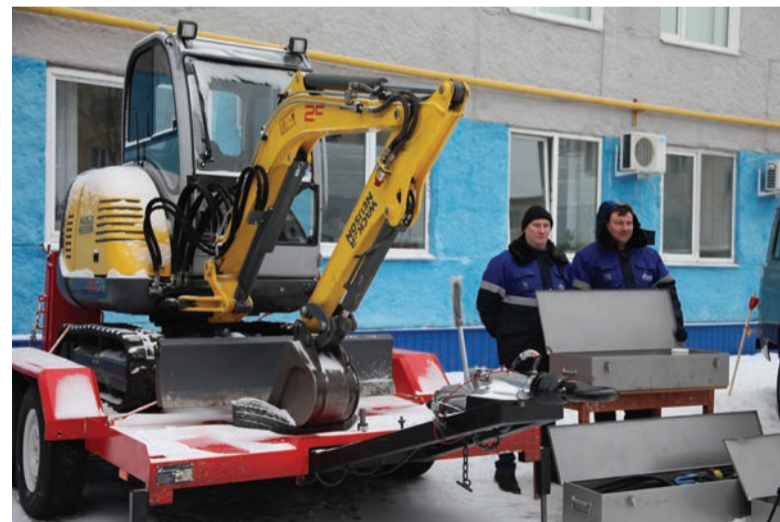
Водители получили новые автомобили