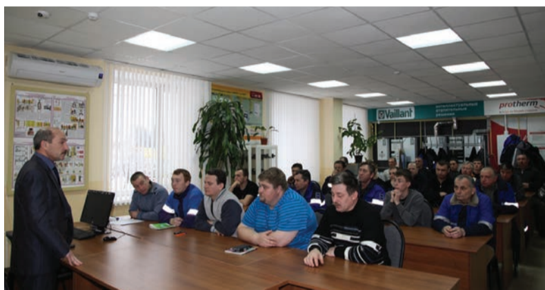
Теоретическая часть обучения пожарной безопасности по программе «Пожарно-технический минимум для электрогазосварщиков»