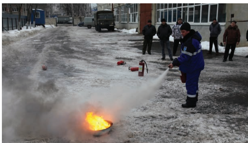
Практическая часть обучения пожарной безопасности по программе «Пожарно-технический минимум для электрогазосварщиков»

Работники, выполняющие электрогазосварочные и другие огневые работы, прошли профессиональное обучение по пожарно-техническому минимуму в учебно-методическом центре АО «Газпром газораспределение Тамбов».