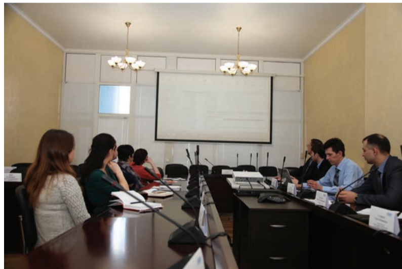
Обучение сотрудников отдела конкурентных закупок и бухгалтерии

В марте продолжится обучение. Специалисты ОИТиС проведут занятия для всех сотрудников компании, ответственных за распределение материалов по филиалам.