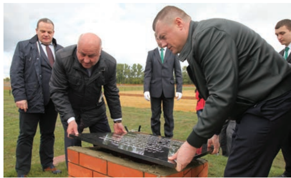
Момент заложения капсулы и установки плиты на тамбовском ипподроме

Глава администрации Тамбовской области Александр Никитин подчеркнул важность социальной направленности проекта. Он уверен, что конно-спортивный комплекс будет интересен жителям Тамбовщины разных возрастов, но особенно детям и молодежи.