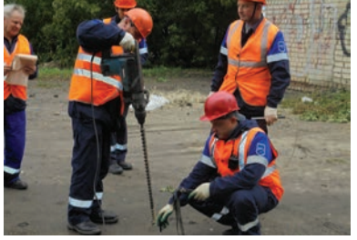
Бригада АДС определяет место утечки газа подземного газопровода низкого давления методом бурового обследования

22 сентября прошли учебно-тренировочные учения аварийно-диспетчерской службы филиала АО «Газпром газораспределение Тамбов» в г. Тамбове. В ходе учений были отработаны действия бригады аварийно-диспетчерской службы при поступлении аварийной заявки «Запах газа в подвале» в соответствии с Планом локализации и ликвидации аварий и Планом взаимодействия служб различных ведомств города.