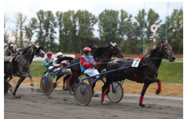
Заезд участников соревнований