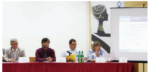
Проведение совещания по организации внедрения АИС «Аналитика»

15 сентября по заданию Управления ИУС ООО «Газпром межрегионгаз» работниками нашей компании проведено совещание в формате видеоконференции по организации внедрения АИС «Аналитика» с организациями 5-й очереди внедрения Северо-Кавказского ФО. Также проведена видеоконференция еще с 10 организациями Сибирского ФО. Результаты видеоконференции оценены руководством Управления ИУС ООО «Газпром межрегионгаз» положительно.