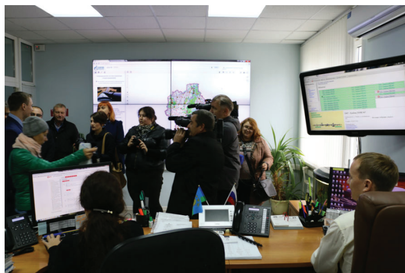
Посещение журналистами ЦДС АО «Газпром газораспределение Тамбов»

газоснабжения, в режиме реального времени позволяет оперативному персоналу газовой компании обеспечивать эффективное управление режимами газоснабжения. А также осуществлять взаимодействие с областными аварийными службами, правоохранительными органами, администрацией области и органами местного самоуправления в ходе локализации и ликвидации аварий и чрезвычайных ситуаций в целях обеспечения надежного и стабильного режима газоснабжения. ■