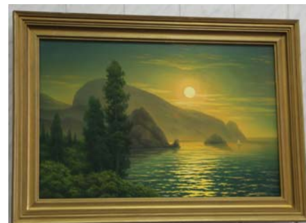
Закат солнца над горой Аю-Даг

Так из – под кисти мастера вышли пейзажи «Собор в городе Моршанске», «Река Кашма», «Фитингофский пруд» и другие. Особое место в творчестве художника занимает морская тематика. Буйство красок и мощь водной стихии вдохновили на создание картины «Вид на гору Аю-Даг в Кры-