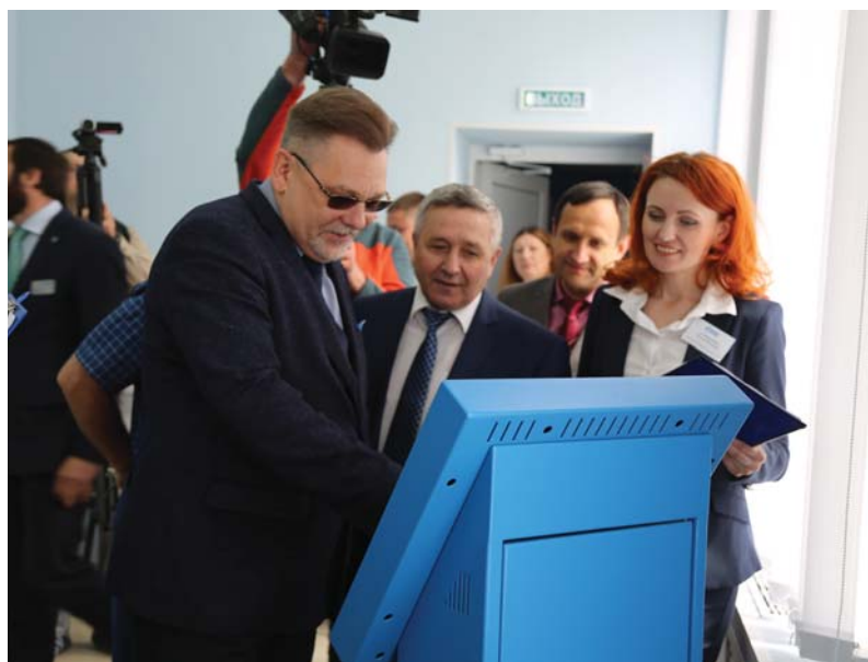
Проверка работы программно-аппаратного комплекса управления очередью

В Тамбовской области работают семь Центров оказания услуг АО «Газпром газораспределение Тамбов», которые являются единой площадкой приёма и консультации потребителей по выполнению комплекса услуг по газификации в минимальные сроки. Центры работают ежедневно по принципу «одного окна».