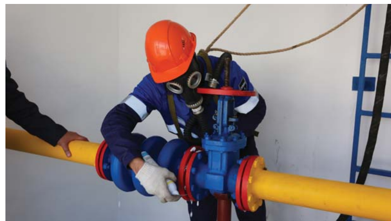
Устранение утечки газа

Профессионализм и мастерство участников конкурса отмечены почётными грамотами.