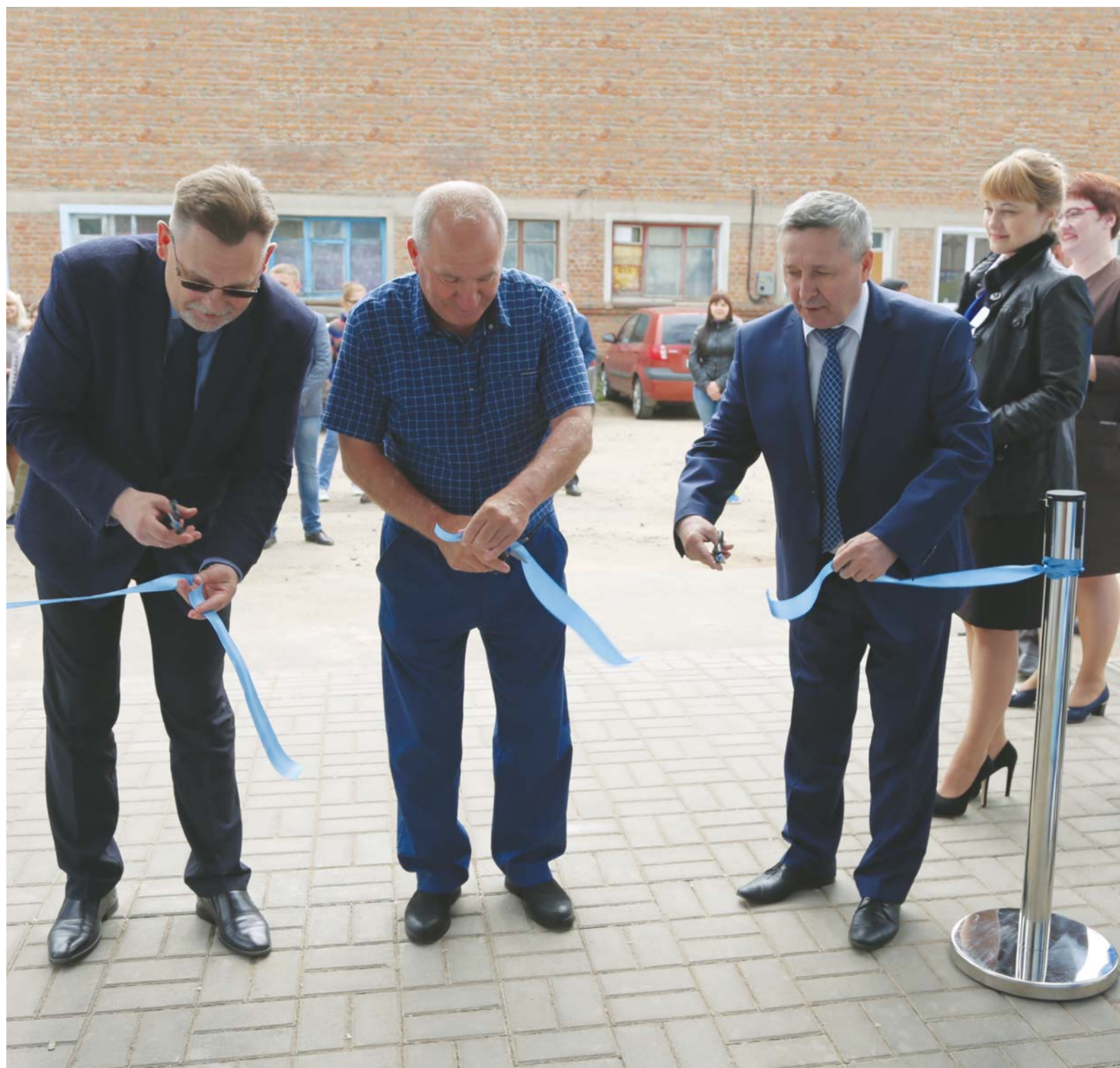
Гостеприимно открыл двери после завершения реконструкции Центр оказания услуг филиала АО «Газпром газораспределение Тамбов» в городе Моршанске (подробнее на стр.2)