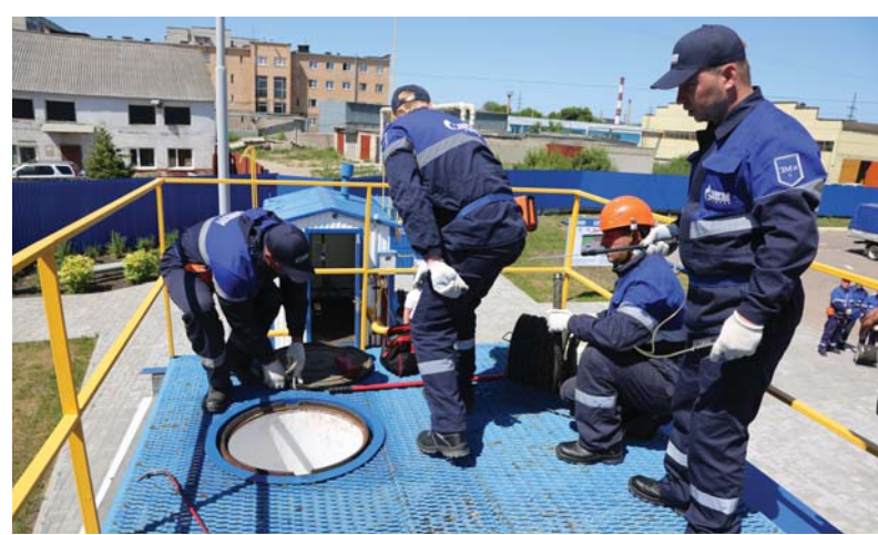
1-й этап соревнований «Загазованность газового колодца»

4-й этап «Действия при обнаружении возгорания в условиях природной среды». Участвовало два представителя от команды. Для тушения природных пожаров (неконтролируемые палы травы, угрожающие газопроводам и устройствам на них) в каждом филиале спасатели обеспечены костюмами добровольца-пожарника «Шанс-Д». Костюм комплекта «Шанс-Д» предназначен для защиты личного состава добровольных пожарных формирований от опасных и вредных факторов окружающей среды,